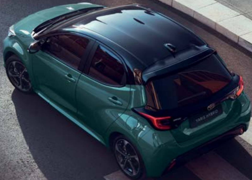
Bi-tone χρωματικές επιλογές Yaris

Επιλέγοντας μέσα από μια εκπληκτική παλέτα εντυπωσιακών χρωμάτων, συμπεριλαμβανομένων των δύο νέων, Juniper Blue και Neptune Blue Bi-tone, το Yaris σας σίγουρα θα ξεχωρίζει.