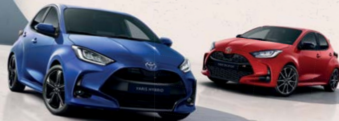
Χρωματικές επιλογές Yaris

• Αποκλειστικά διαθέσιμο στην έκδοση GR-SPORT