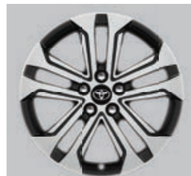
Ζάντες αλουμινίου 18" machined-face (5 διπλές ακτίνες) Προαιρετικά σε όλες τις εκδόσεις