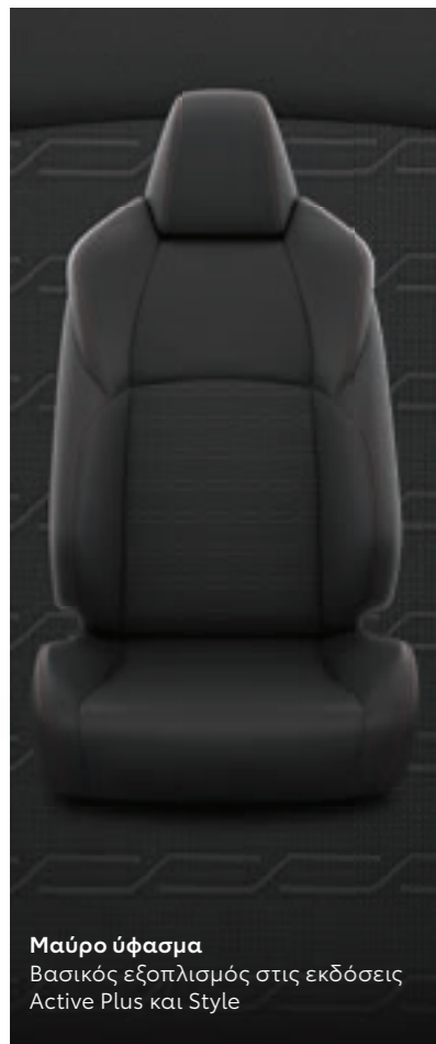
Μαύρο ύφασμα Βασικός εξοπλισμός στις εκδόσεις Active Plus και Style