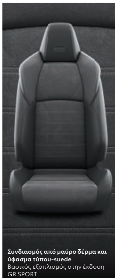
Συνδυασμός από μαύρο δέρμα και ύφασμα τύπου-suede Βασικός εξοπλισμός στην έκδοση GR SPORT