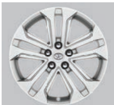
Ζάντες αλουμινίου 18" ασημί Προαιρετικά σε όλες τις εκδόσεις