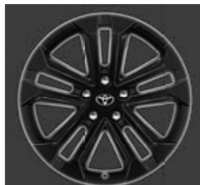
Ζάντες αλουμινίου 18" σε μαύρο χρώμα Προαιρετικά σε όλες τις εκδόσεις