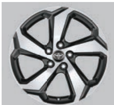
Ζάντες αλουμινίου 18" γκρι (5 ακτίνων) Βασικός εξοπλισμός στις εκδόσεις Active Plus και Style