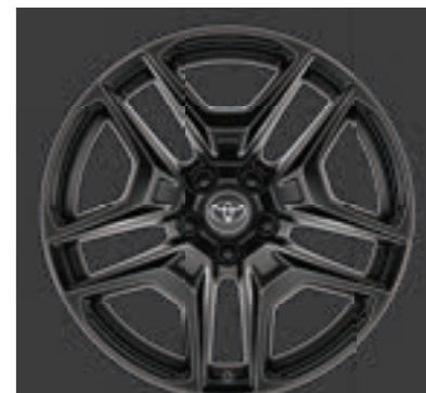
Ζάντες αλουμινίου 19" GR SPORT glossy μαύρο (5 διπλών ακτίνων) Βασικός εξοπλισμός στην έκδοση GR SPORT