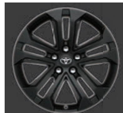
Ζάντες αλουμινίου 18" σε μαύρο χρώμα ματ Προαιρετικά σε όλες τις εκδόσεις