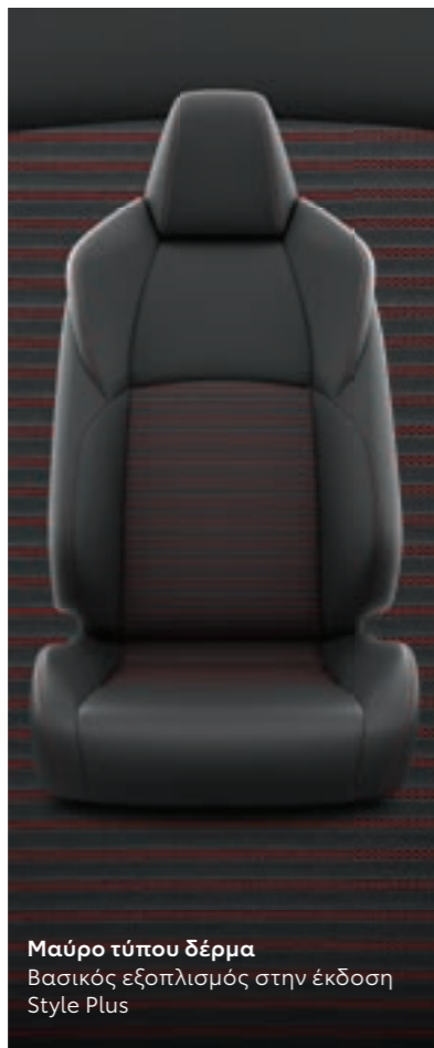
Μαύρο τύπου δέρμα Βασικός εξοπλισμός στην έκδοση Style Plus