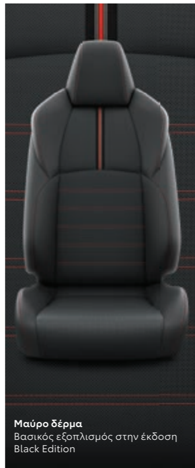
Μαύρο δέρμα Βασικός εξοπλισμός στην έκδοση Black Edition