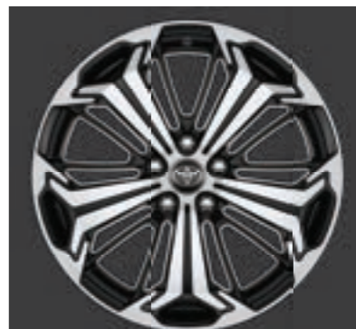
Ζάντες αλουμινίου 19" machined-face (5 ακτίνων) Βασικός εξοπλισμός στις εκδόσεις Style Plus και Black Edition