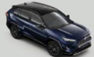
2RA Bi-tone Σκούρο Μπλε* (8X8/218)