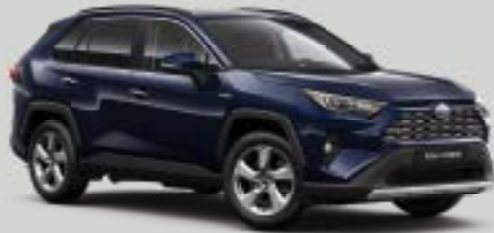
8X8 Σκούρο Μπλε*