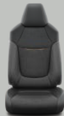
Μαύρο Alcantara® και δέρμα με καφέ saddle ραβδώσεις και ραφές* Προαιρετικά σε όλα τα πακέτα