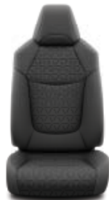
Μαύρο ύφασμα Έκδοση Active & Style

Οι λεπτομέρειες μετράνε. Επιλέξτε την επένδυση που σας ταιριάζει.