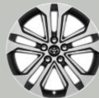
Ζάντες αλουμινίου 18" machined- face (5 διπλές ακτίνες) Προαιρετικά σε όλες τις εκδόσεις