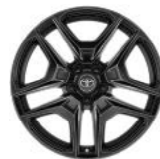
Ζάντες αλουμινίου 19" GR SPORT glossy μαύρο (5 διπλών ακτίνων) Έκδοση GR SPORT