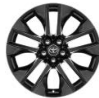
Ζάντες αλουμινίου 19" μαύρες (5 διπλών ακτίνων) Έκδοση Black Edition