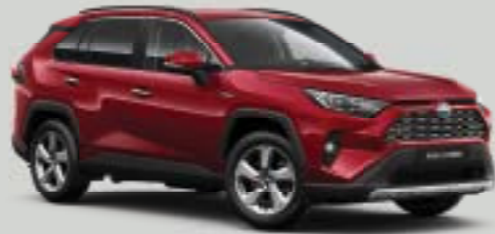
3T3 Κόκκινο της Πέρλας**