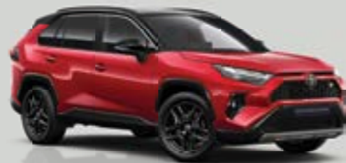
Bi-tone Κόκκινο 2SC (3U5/218)***