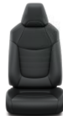
Μαύρο δέρμα Έκδοση Lounge