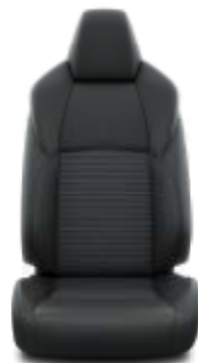
Καθίσματα με υφή δέρματος και μπλε ραφές Έκδοση Black Edition