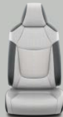
Γκρι και μαύρο δέρμα* Προαιρετικά σε όλα τα πακέτα