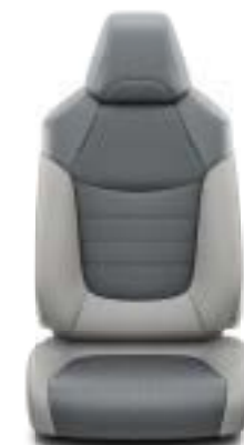
Ανοιχτό γκρι δέρμα Έκδοση Lounge