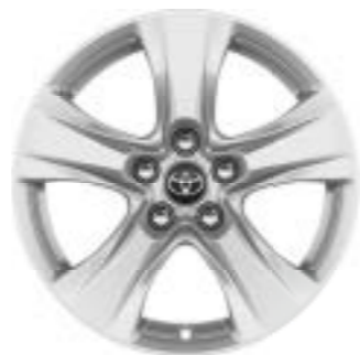
Ζάντες αλουμινίου 17" (5-άκτινη) Έκδοση Active

Ακόμα καλύτερο όταν κινείται. Διαλέξτε τη ζάντα που θα ξεχωρίσει για το δικό σας RAV4.