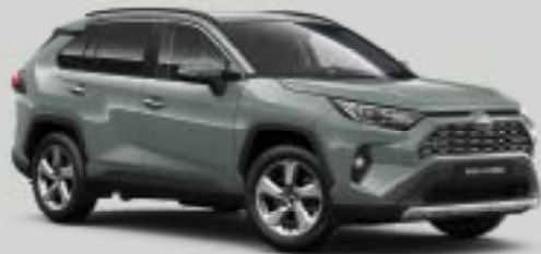
6X3 Ανοιχτό Χακί