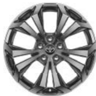
Ζάντες αλουμινίου 18" (5-άκτινη) Έκδοση Style