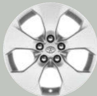
Ζάντες αλουμινίου 17" ασημί Προαιρετικά σε όλες τις εκδόσεις