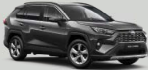
1G3 Σκούρο Γκρι*