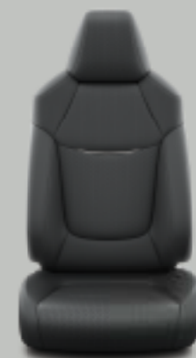
Μαύρο δέρμα με γκρι ραβδώσεις και ραφές* Προαιρετικά σε όλα τα πακέτα

* Αποτελείται από φυσικό δέρμα και συνθετικό δέρμα.