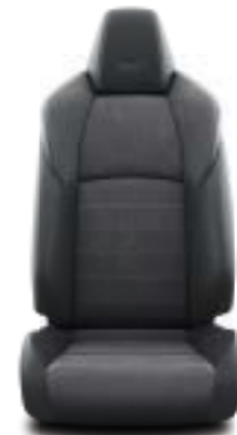
GR SPORT μαύρο δέρμα με καστόρι υφή και ασημί ραφές Έκδοση GR SPORT