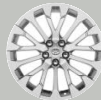
Ζάντες αλουμινίου 19" Προαιρετικά σε όλες τις εκδόσεις