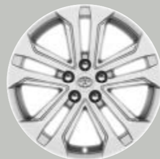
Ζάντες αλουμινίου 18" ασημί Προαιρετικά σε όλες τις εκδόσεις