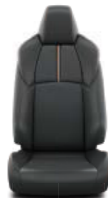
Μαύρο δέρμα με πολυγωνικό σχέδιο και πορτοκαλί ραφές Έκδοση Adventure