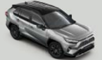
2QY Bi-tone Ασημί* (1D6/218)