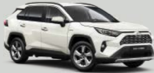
089 Λευκό της Πέρλας**