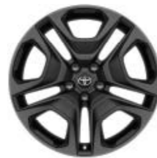
Ζάντες αλουμινίου 19" (5 διπλών ακτίνων) Έκδοση Adventure