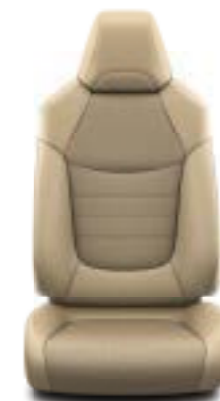
Μπεζ δέρμα Έκδοση Lounge