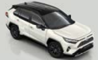
2P5 Bi-tone Λευκό της Πέρλας** (089/218)

***Μεταλλικό περλέ αποκλειστικά στην έκδοση GR SPORT