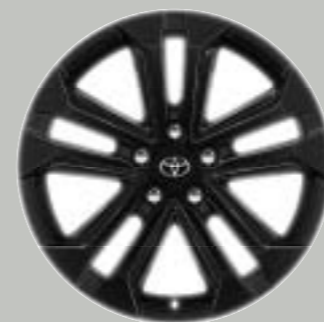
Ζάντες αλουμινίου 18" σε μαύρο χρώμα Προαιρετικά σε όλες τις εκδόσεις