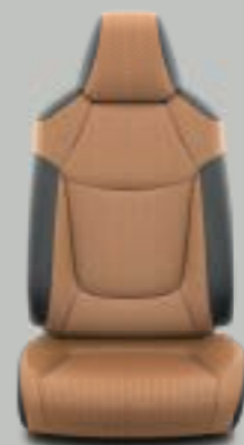
Καφέ Saddle και μαύρο δέρμα* Προαιρετικά σε όλα τα πακέτα