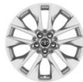
Ζάντες αλουμινίου 19" (5 διπλών ακτίνων) Έκδοση Lounge