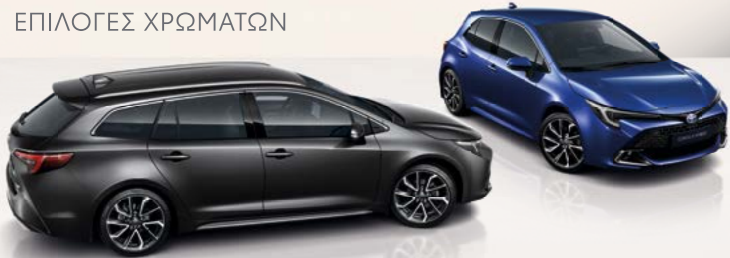
Χρωματικές επιλογές για το Corolla σας