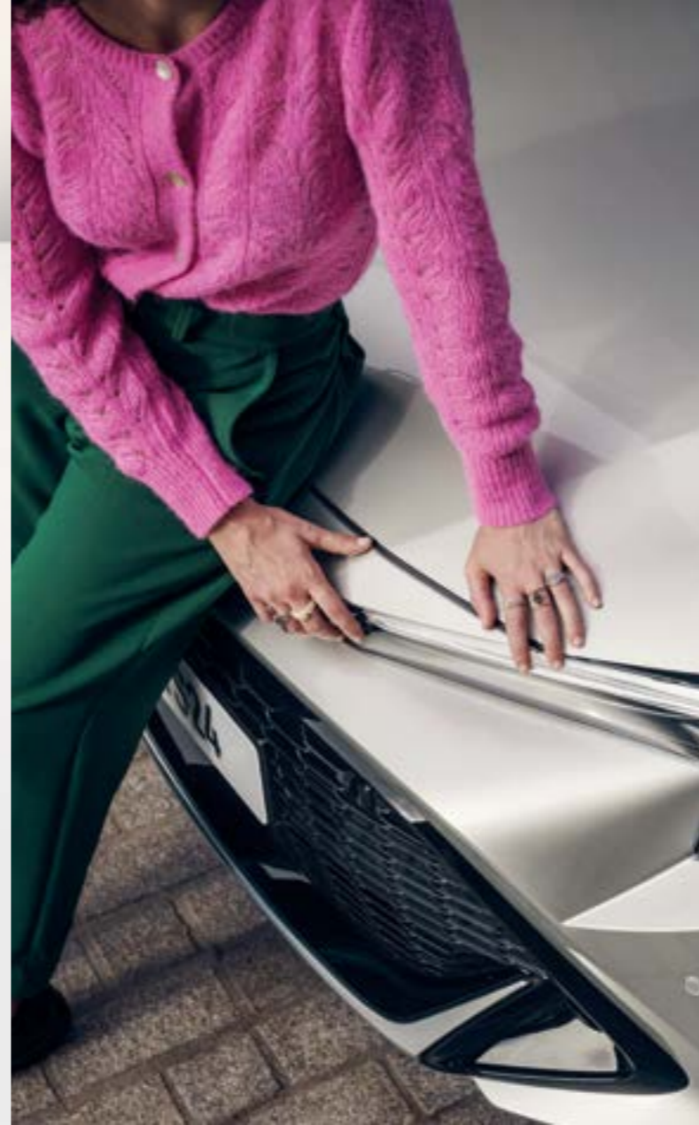
Επιλογές bi-tone συνδυασμών